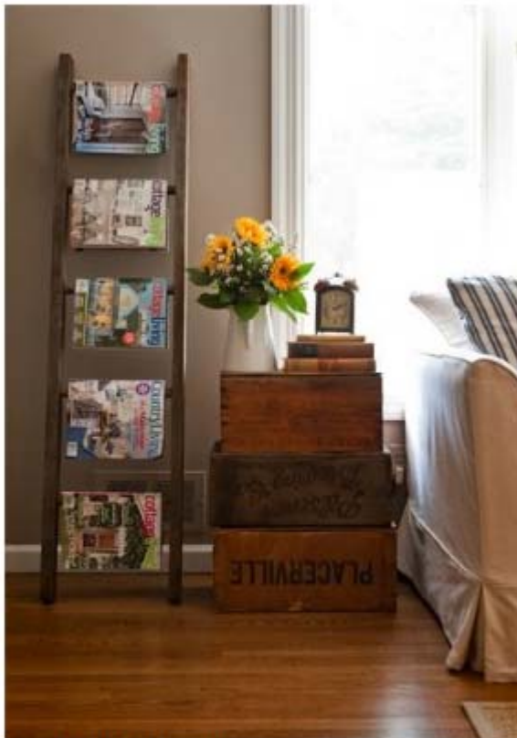
Ladder als tijdschriftenhouder